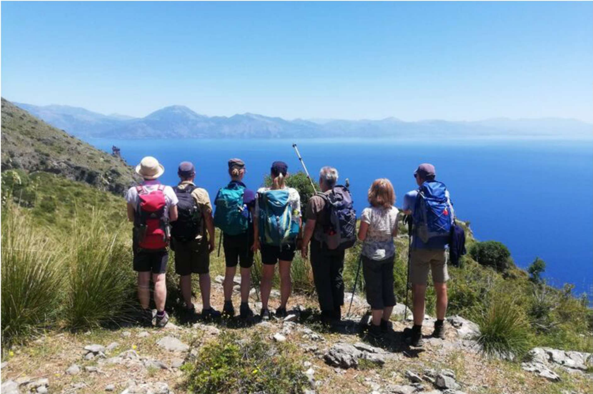
Blick auf den Golf von Salerno

Einstieg: loc. Fiume Freddo Länge: 10km circa Schwierigkeit: E (Wandern), eine gewisse Grundaussdauer, sowie keinerlei Mobilitätseinschränkungen sind Voraussetzung Höhenunterschied: 450m Abfahrt Trezene: 8.30h (circa 1Std. Fahrt) Wanderung: 9.30-15.00h Rückfahrt: circa 15h Abendessen: 20h