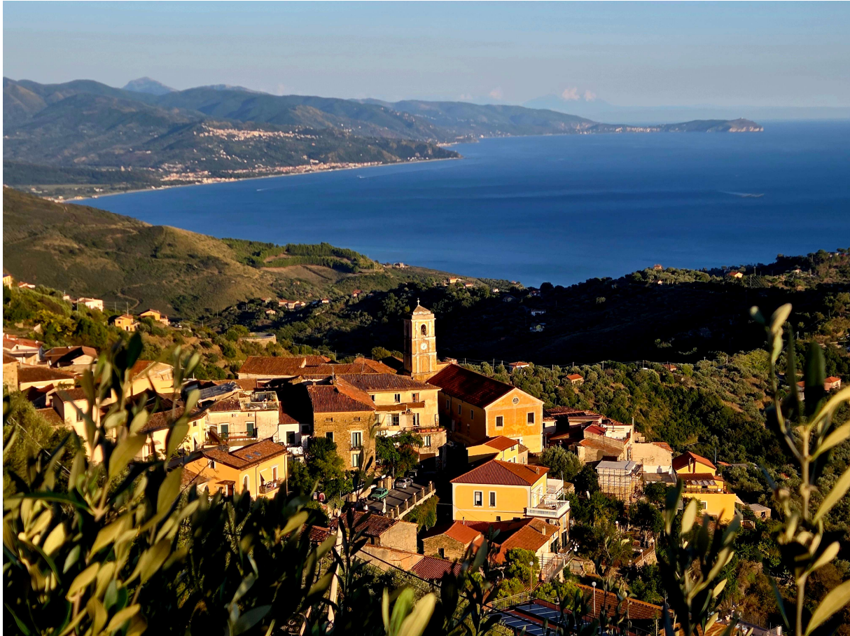
Pollica, im Hintergrund die Halbinsel Palinuro