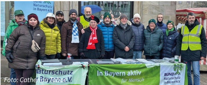
Foto: Catherine So funktioniert gemeinschaftliche und gelebte Kommunalpolitik: Gemeinsame Unterschriftensammlung für die Einwendungen des BN gegen die Stromtrasse und das zweite Umspannwerk in Ludersheim.

Wir Grünen in Altdorf stehen immer bereit für ein gutes Klima...so oder so!